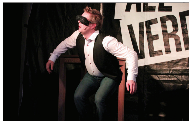
"Fysisk" komikar: Brekke er kjend for å bruke heile kroppen når han står på scena. Her viser han alt ei fluge rekk å gjere frå vi slår mot ho - til vi treff noko heilt anna.