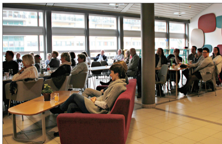
Flott arena: Kulturhuset skal ha skryt for rammene rundt arrangementet. Å setje opp scene i foajeen, og la folk sitte rundt bord og i sofaer var høveleg til denne typen arrangement.

utfordrande fordi dei som er der ikkje nødvendigvis høyrer på meg frivillig, fortalde han til Fjordingen etter showet. Det er viktig å skjønne kva dei som sit i salen i dag vil le av eller kan kjenne seg att i.